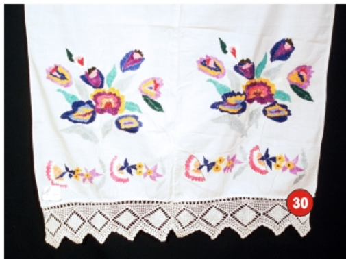
30. Фіранка полотно — бавовна кольорова вишивка «букет квітів», техніка — «гладь». Мереживо — ручне, плетіння гачком 77х98 см.