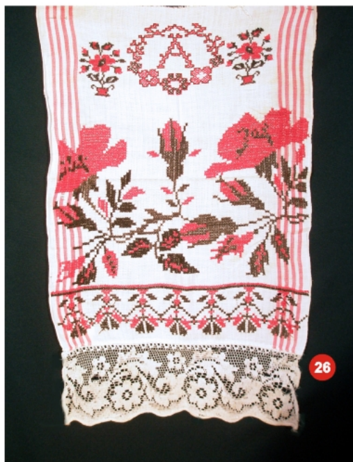
26. Рушник - фрагмент полотно — льон мережки, вишивка ткані червоні смужки 39x62 см.