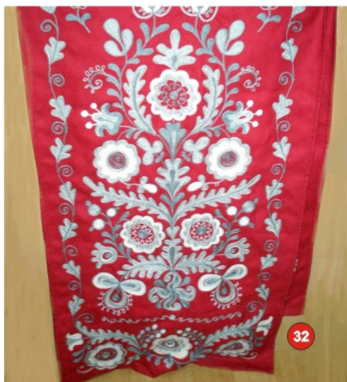
32. Рушник «Дерево життя» полотно — червоне, машинна вишивка 90х400 см