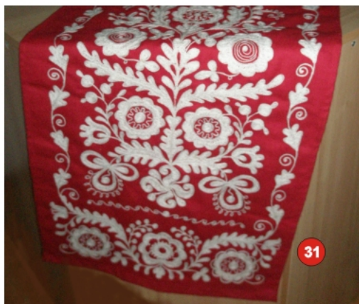
31. Рушник «Дерево життя» полотно — червоне, машинна вишивка 90х400 см.