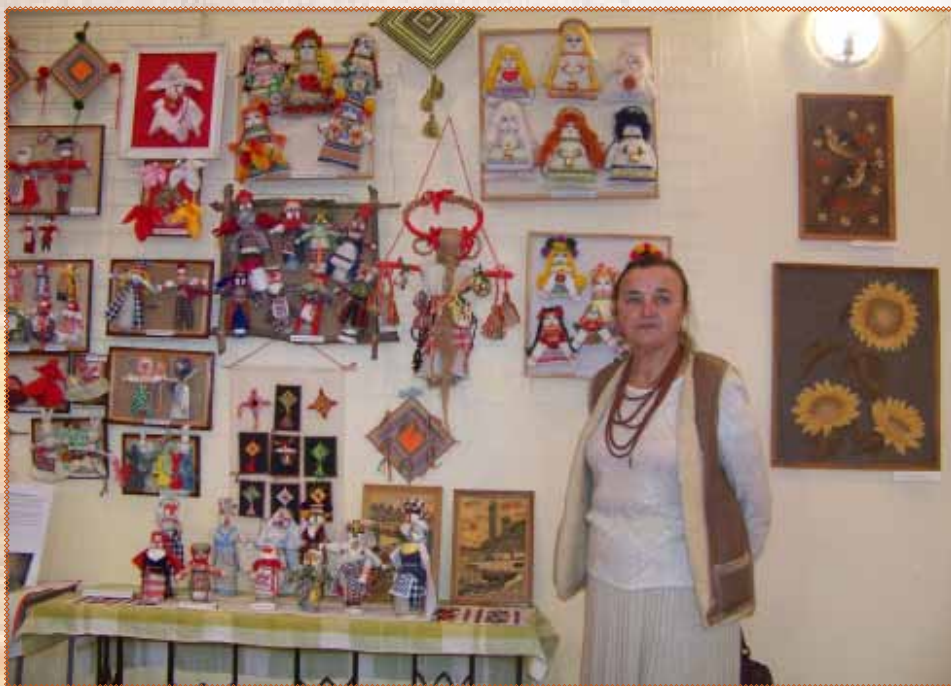
Галина КАЖАН, Заслужена артистка України

Ведучий: І саме зараз, коли високе мистецтво надихає нас на сокровенні почуття, ми згадуємо тих, кого уже немає поряд з нами. Тих, хто жив і творив задля того, щоб було у цьому світі більше краси, співзвучних гармоній, щоб життя наше пробігало не так одноманітно од свого початку аж до завершення, а нуртувало яскравими фарбами, високим духом слова, поезії, мистецтва.