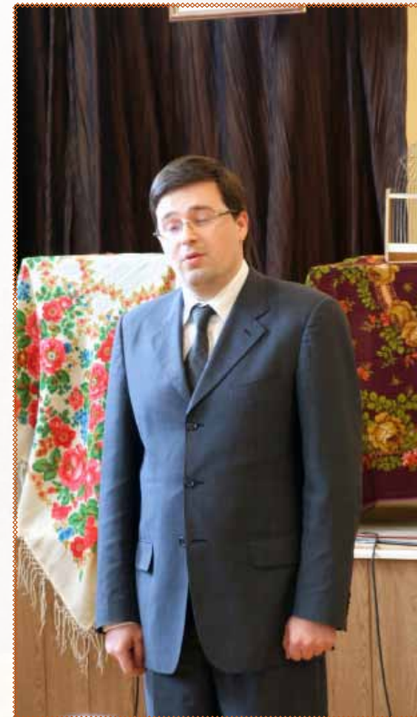
Владислав СТАНКОВ, начальник управління культури і туризму Одеської облдержадміністрації