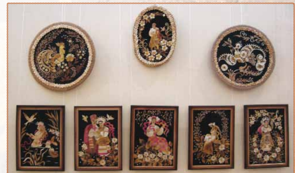
Аплікація соломкою Кушнір Г.К., стипендіата премії ім. Р.Палецького 2007 року /м.Балта/