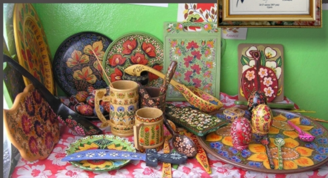
Декоративний розпис ужиткових предметів