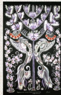
Чорна ніч інкрустована ніжністю