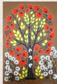
Фантазія пізньої осені