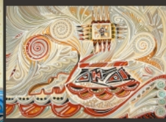
Артанія (Родина, Духовність, Добробут), триптих