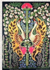
Весні радіють всі