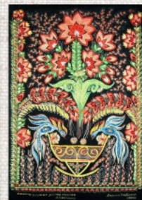
Стоїть у рожах золота коліска