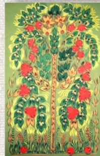
Щедроті молодого яблука