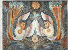
А життя продовжується