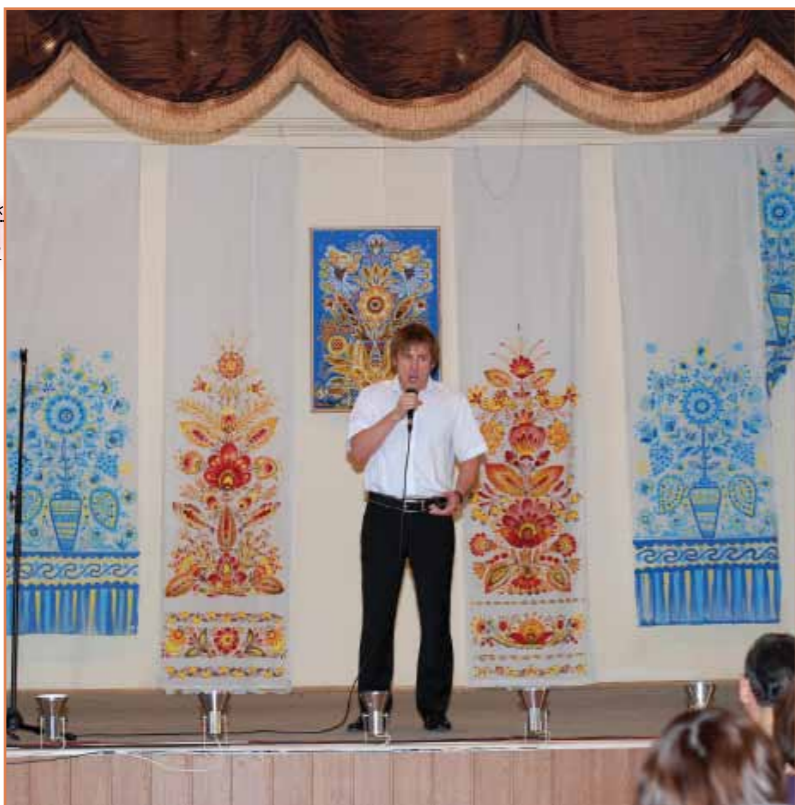
Звучить пісня у виконанні Лауреата Міжнародних конкурсів Віталія Ончуленка

(дефіле «Из пены морской» демонструють студенти Одеського професійного ліцею технологій та дизайну Південноукраїнського національного педагогічного університету ім. К.Д. Ушинського)