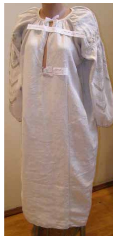
Українська жіноча сорочка (Полтавщина, кінець XIX ст.) з колекції Людмили ЄФІМОВОЇ (м. Ізмаїл)