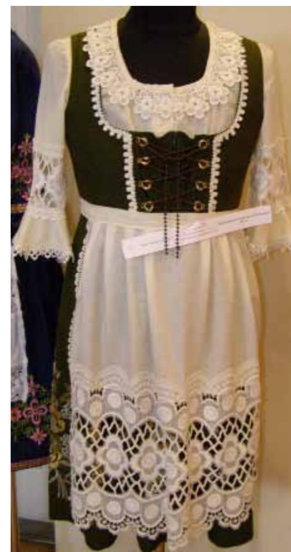
Німецький весільний костюм (Баварія), ХІХ ст. з колекції Оксани ОРЕП (с. Кремидівка Комінтернівського р-ну, Німецький культурний центр)